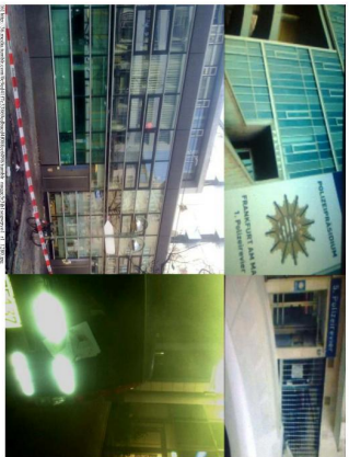
15.09.2015 07:27 http://www.rind.rindh.com/post/12916281945