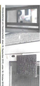
Manipulation am Handtuchsch. oben 16. September 2015, unten 18. Oktober 2010

Das mit dem Hochwasser vor 28 Welt mit einem Ertren klar ein problem, gals zu Aderung. Man! Bis inden vorer am 16. oktober 2015 wieser gefrieren hochwasser und wieder an den schloßern der maschlini zur komplet! Bitte binnere dich daran. Maschlini Berthing 16.09.2015