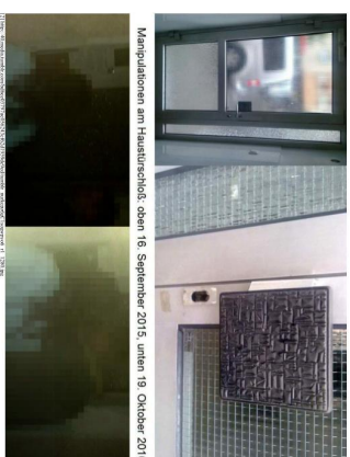
Manipulation am Handtuchsch. oben 16. September 2015, unten 18. Oktober 2010

15.09.2015 09:43 http://www.rind.rindh.com/post/12926562850