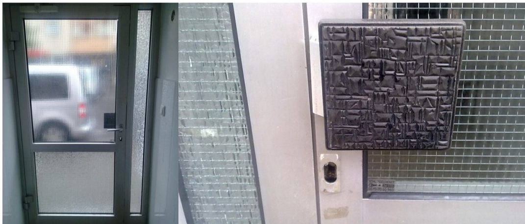
Manipulationen am Haustürschloß: oben 16. September 2015, unten 19. Oktober 2010

Das mit den Schlössern war ja seit meinem Einzug hier ein Problem, ich erinnere mich noch an das Chaos mit diesen elektronischen Schlüsseln ganz zu Anfang. Nun! Wie schon zuvor am 19. Oktober 2010 wurde gestern Nachmittag mal wieder an den Schlössern der Haustür zur Hölderlinstraße hin manipuliert, heute Morgen fehlt das Schloss komplett! Bitte kümmere dich darum.